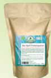
Erdschwalbe Hanf Proteinpulver

Als Pizza- oder Flammkuchenteig vielfältig zu belegen. Kohlenhydratarm.