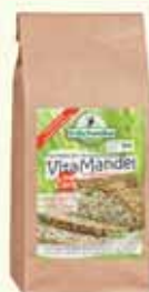
Erdschwalbe VitaMandel LowCarb

*Hanf enthält alle 21 Aminosäuren, darunter alle 8 essentiellen Aminosäuren in leicht bioverfügbarer Form. Zudem besitzt Hanf einen hohen Anteil an mehrfach ungesättigten Fettsäuren im perfekten Verhältnis von 3:1 (Omega-6 zu Omega-3).